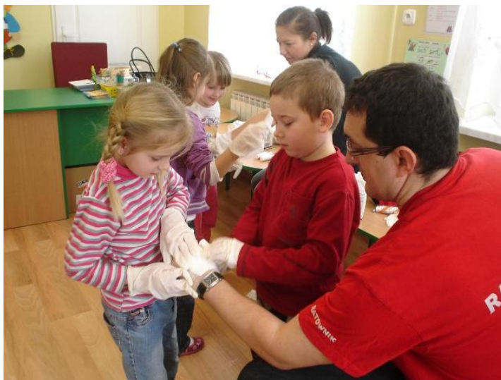
Ćwiczenia praktyczne wypadły wzorowo

Bardzo ważne jest więc wprowadzenie tematyki pierwszej pomocy i osvajanie z nią najmłodszych. 23 lutego dzieci 5 i 6-letnie z Gminnego Przedszkola w Malanowie wzięły udział w pokazie pierwszej pomocy, zorganizowanym przez ratowników medycznych z Fundacji „Złota Godzina”. Szkolenie miało na celu przygotowanie dzieci do wykonywania prostych czynności ratowniczych oraz do racjonalnych zachowań w przypadku wystąpienia różnych zagrożeń. Dzieci w formie zabawy uczyły się jak i kiedy należy wezwać karetkę pogotowia, jak zachować się w przypadku skaleczenia, oparzenia, czy omdlenia.