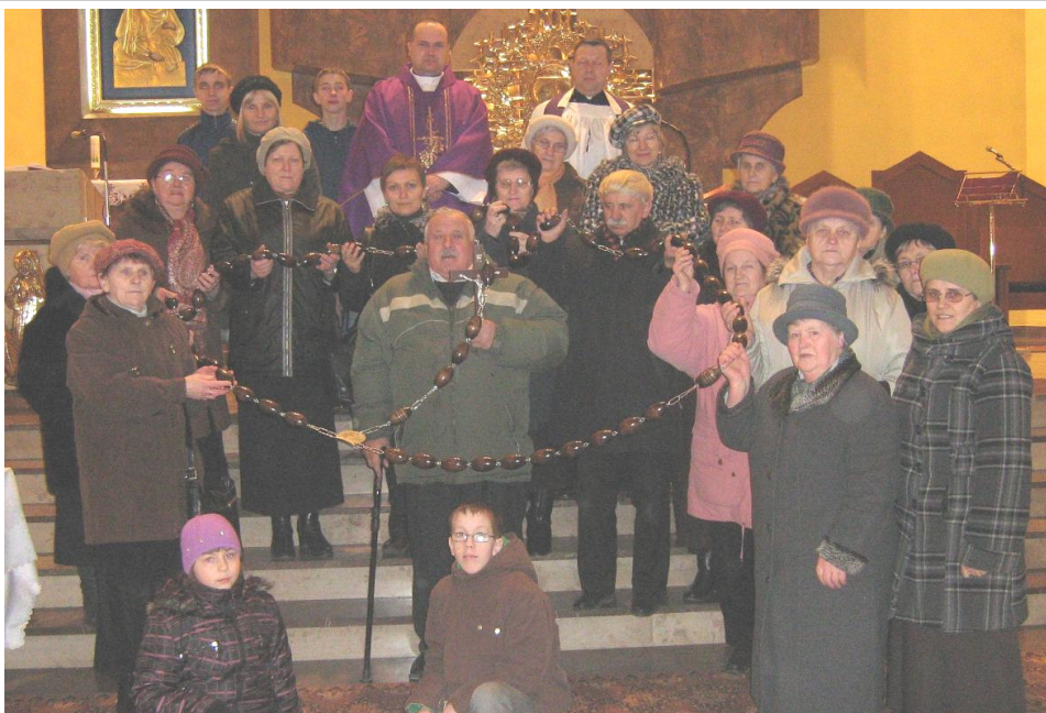
Różaniec procesyjny ufundowany przez jedną ze wspólnot Żywego Różańca

Dziękujemy ks. prałatowi za Mszę świętą, jaką odprawił za nas i za formację różańcową. Mieszkańców naszej parafii serdecznie zachęcamy do takiej wspólnoty modlitewnej, możemy przecież utworzyć jeszcze wiele takich rodzin różańcowych. Wystarczy, by kolejnych 20 osób zechciało poświęcić