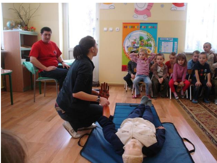
Przedszkolaki z ochotą uczyły się udzielać pierwszej pomocy

Po części teoretycznej z ochotą przystąpiły do ćwiczeń praktycznych, tj. opatrywania ran, cucenia po omdleniach, wzywania karetki pogotowia. Sprawilo im to niemałą frajdę. Przedszkolaki przypomniły sobie również zasady bezpiecznego zachowania się na drodze, w pobliżu zbiorników wodnych, itp.