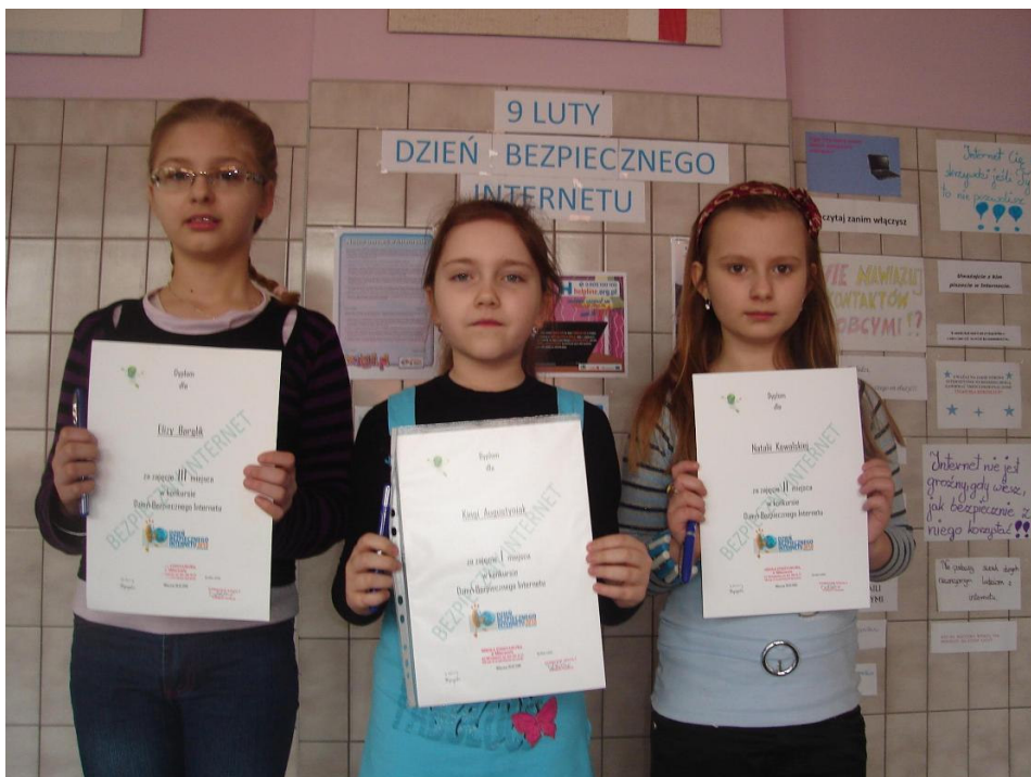
Laureatki konkursu na hasło dotyczące bezpieczeństwa w Internecie

Pozostałe trzy inicjatywy to: gazetka na korytarzu szkolnym pt. „9 lutego Dzień Bezpiecznego Internetu” zawierająca kolorowe plakaty wydrukowane z materiałów mul-