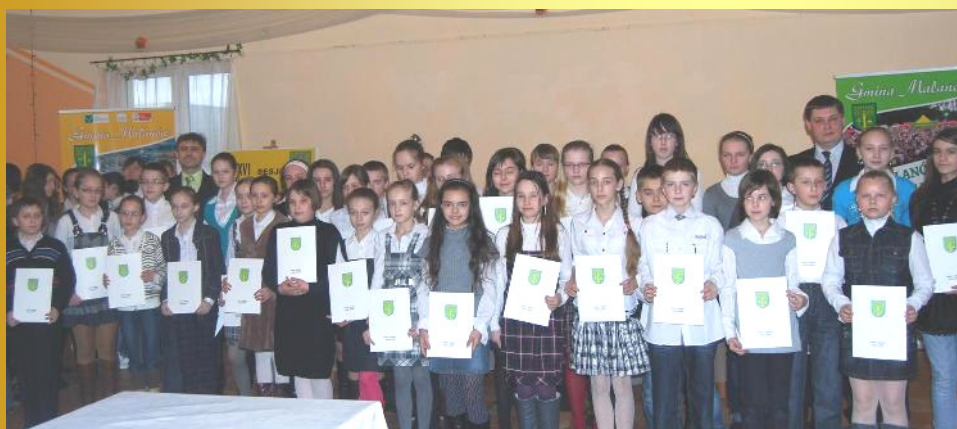
Stypendyści ze szkół podstawowych gminy Malanów

ocen za I półrocze roku szkolnego minimum 5,00 i wzorowa lub bardzo dobra ocena z zachowania. Możliwość przyznania stypendium za wyniki w nauce dała podjęta w lutym 2009 r. przez Radę Gminy Malanów Uchwała Nr XXV/168/2009 „w sprawie regulaminu przyznawania stypendium za wyniki w nauce dla uczniów szkół podstawowych i gimnazjum dla których gmina Malanów jest organem prowadzącym”.