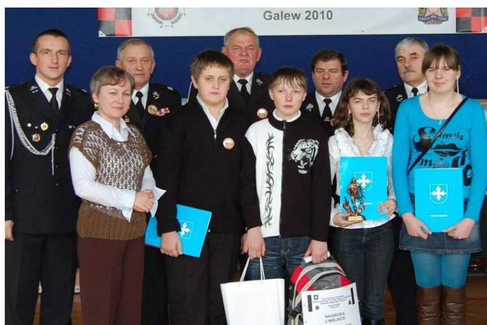
Reprezentacja gminy Malanów z organizatorami