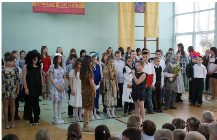
Apel w wykonaniu uczniów klasy IV b

Magdalena Nowicka nauczycielka SP w Malanowie