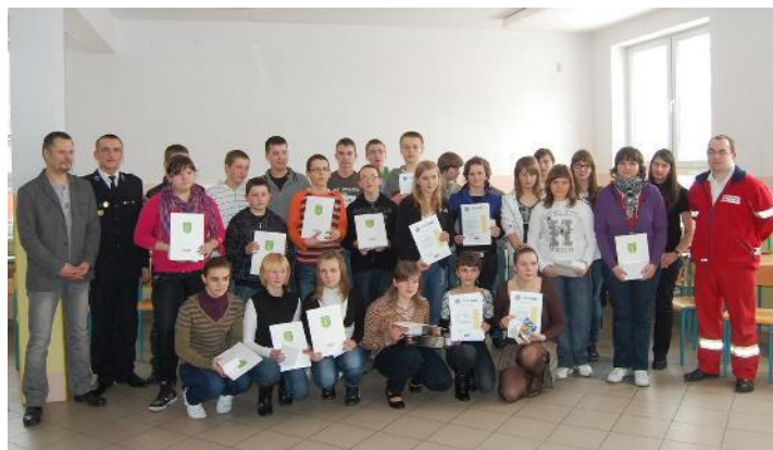
Uczestnicy konkursu z Gimnazjum w Malanowie

Turniej propaguje wiedzę z zakresu ochrony przeciwpożarowej oraz szeroko pojmowanego ratownictwa wśród dzieci i młodzieży szkolnej. Jego celem jest popularyzacja znajomości przepisów przeciwpożarowych, wpojenia zasad postępowania na wypadek powstania pożaru oraz nabycia praktycznych umiejętności z zakresu udzielania pierwszej pomocy. Jest to nauka interdyscyplinarna, która skupia w sobie bogactwo tradycji historycznych z nowoczesną technologią i technikami ratowniczo-gaśniczymi.