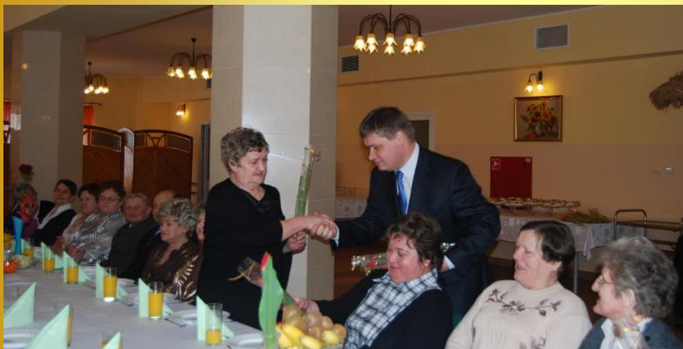
Każda Pani została obdarowana tulipanem