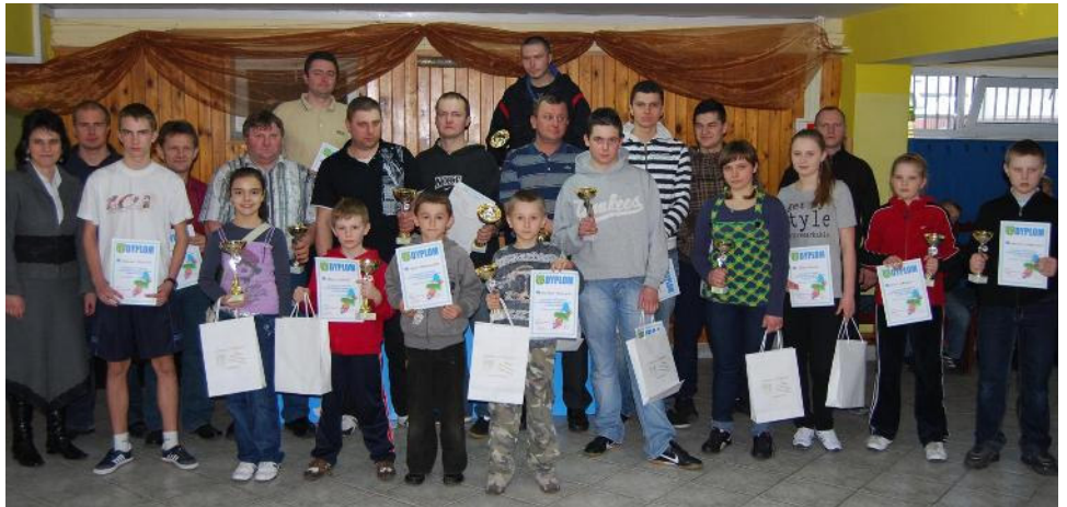
Zwycięzcy w poszczególnych kategoriach wiekowych