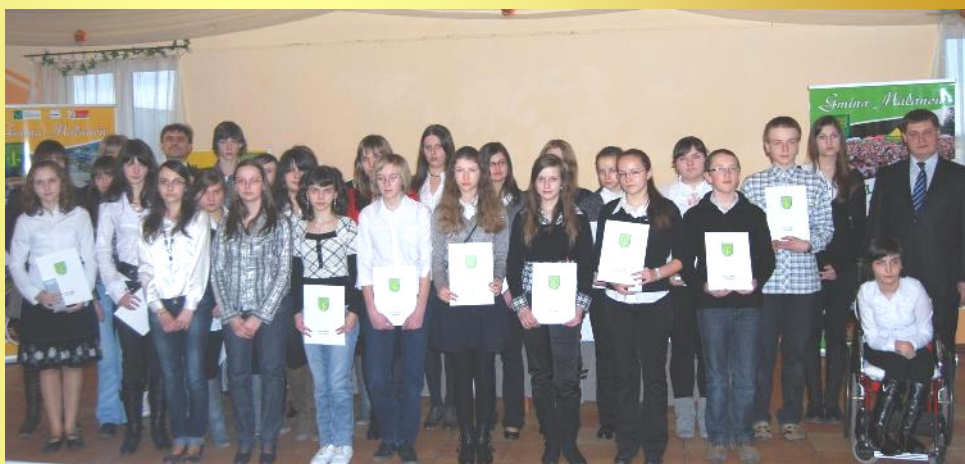
Stypendyści z Gimnazjum w Malanowie

Warto przypomnieć, że warunkiem uzyskania stypendium była średnia