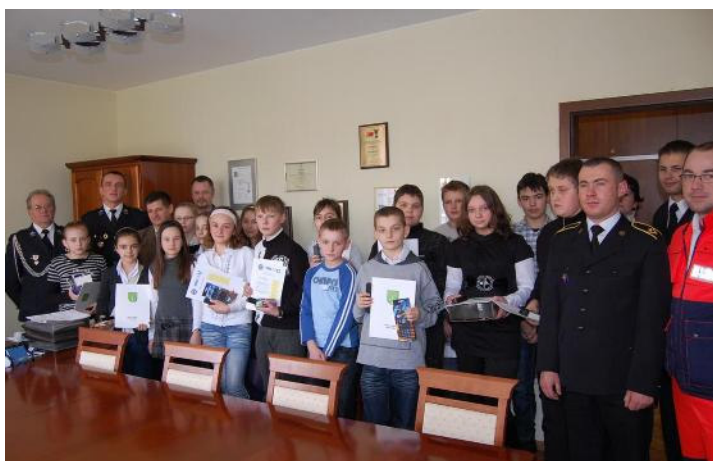
Uczestnicy konkursu – reprezentanci szkół podstawowych

Organizatorami eliminacji gminnych tradycyjnie byli Komisja ds. Młodzieży ZOG ZOSP RP oraz Zarząd Oddziału Gminnego Związku Ochotniczych Straży Pożarnych RP w Malanowie.