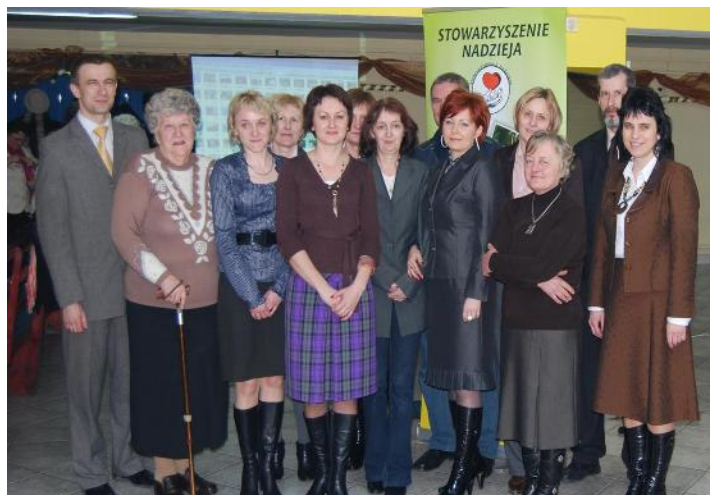
Nowe władze Stowarzyszenia „Nadzieja”